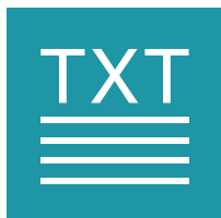
Transcription instantanée de la parole (TIP)

Service gratuit de transcription, de visio-interprétation et de visio-codage en temps réel. 3 solutions vous sont proposées :