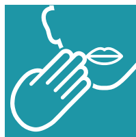
Visio-codage langue française parlée complétée (LPC)