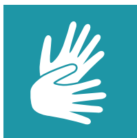
Visio-interprétation en langue des signes française (LSF)