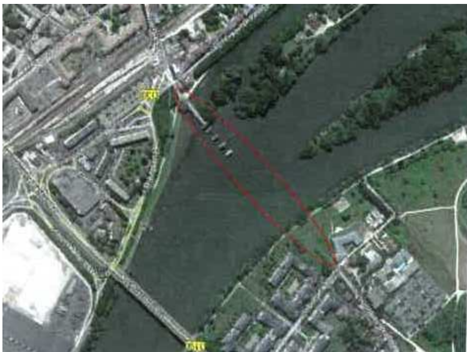
Localisation de la zone

L'objectif du projet vise à proposer un nouveau franchissement en mode doux mettant en relation les communes de Poissy et Carrières-sous-Poissy et constituant une véritable opportunité de développement du territoire.